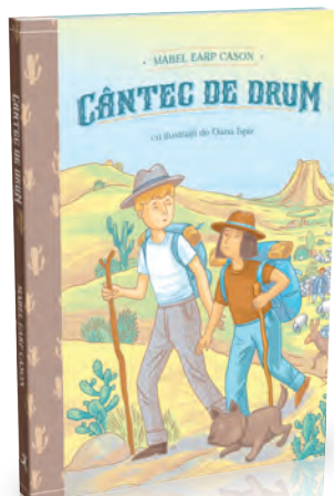
Cântec de drum 192 pagini