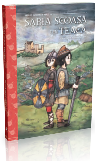
Sabia scoasă din teacă 176 pagini