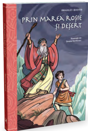
Prin Marea Roșie și deșert 224 pagini