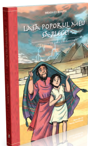
Lasă poporul Meu să plece! 184 pagini